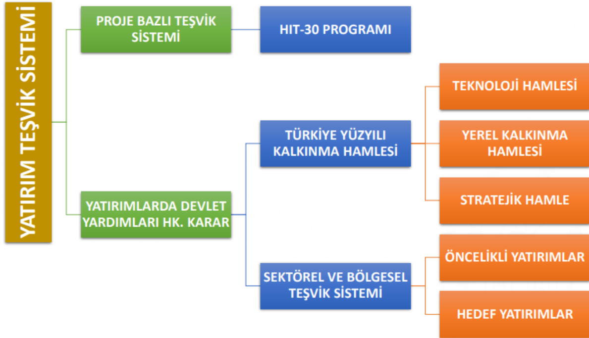
Şekil 1. Yeni Teşvik Sisteminin Kurgusu